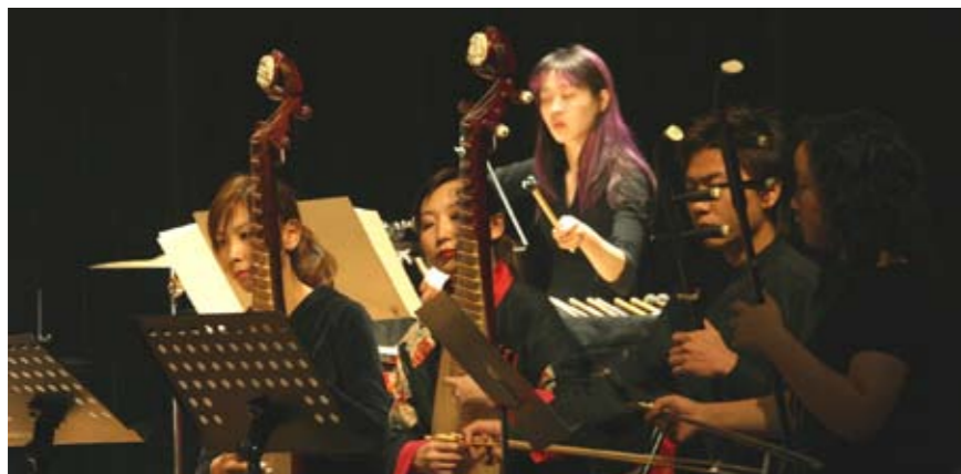
La Fabrique du jeu - chine 2004

Création : Atelier Lyrique du Rhin/Colmar 1990