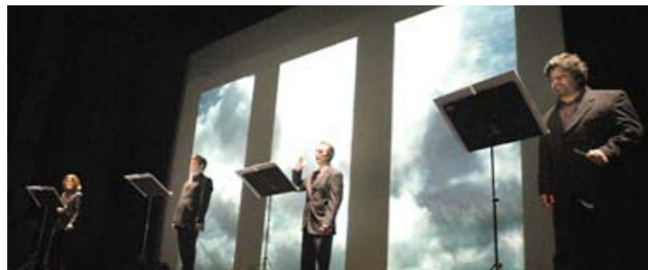
L'océan suit la silence - Neue Vocalsolisten Stuttgart

Création : 19 mars 2004 /Centre Théo Argence, Saint Priest, Biennale Musiques en Scène par les Neue Vocalsolisten Stuttgart