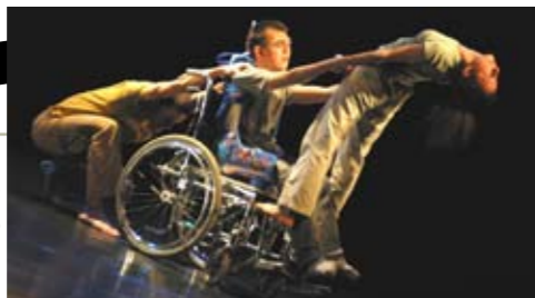
Sensations partagées

Collaboration artistique et réalisation des musiques pour les spectacles de danse de la Cie Hallet Eghayan de 1975 à 1983 (15 créations)